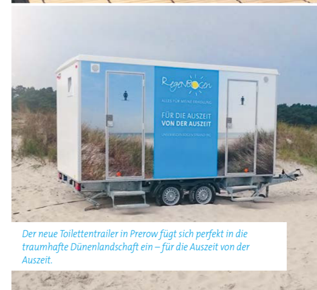
Der neue Toilettentruer in Prerow fügt sich perfekt in die traumhafte Dünenlandschaft ein – für die Auszeit von der Auszeit.