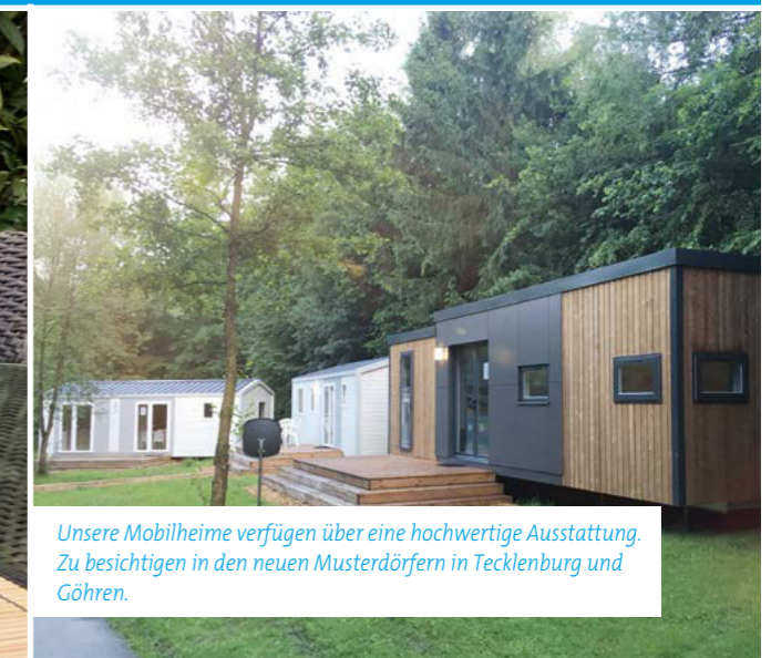
Unsere Mobilheime verfügen über eine hochwertige Ausstattung. Zu besichtigen in den neuen Musterdörfern in Tecklenburg und Göhren.