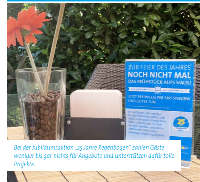
Bei der Jubiläumsaktion „25 Jahre Regenbogen“ zahlen Gäste weniger bis gar nichts für Angebote und unterstützen dafür tolle Projekte.